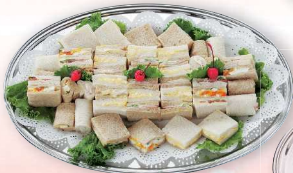
ミックスサンド 3,240円