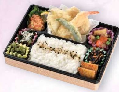
幕の内弁当あおぎり 1,080円

幕の内弁当限定 ごはんを(穴子飯) (そばろご飯) にバージョンアップ 108円