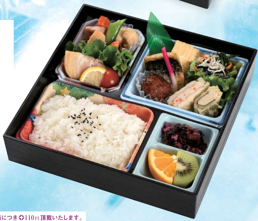
会議用彩り弁当 1,080円

大切な会議や会合の合間に、 緊張した心をときほぐす 手作り弁当はいかがですか？ 栄養バランスを考えた一品一品に、 繊細な味付けをしつらえました。