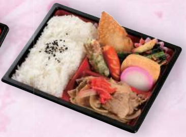
お手ごろ幕の内弁当 648円