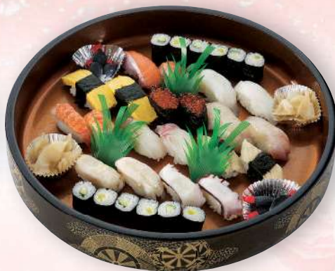
寿司盛【にぎり・巻物】 3,240円