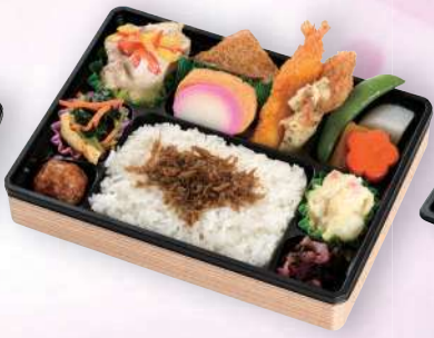
幕の内弁当おりづる 1,080円