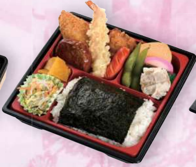
しおさい幕の内弁当 864円