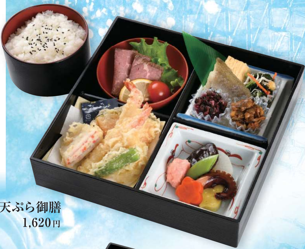
会議用天ぷら御膳 1,620円

海老や野菜の天ぷら盛り合わせや 旨味をふくんだ炊き合わせなど、 厳選された贅沢御膳をご堪能ください。