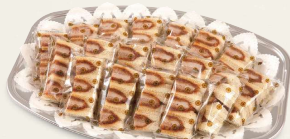
ヒレかつサンドオードブル A(ハーフカットヒレ18パック) 4,400円(税込4,752円) B(ハーフカットヒレ22パック) 5,400円(税込5,832円) C(ハーフカットヒレ26パック) 6,300円(税込6,804円)