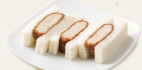
メンチかつサンド [3切] 400円(税込432円)