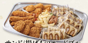
サンド/揚げものオードブル 一口ヒレかつ・海老フライ・クリームコロッケ ウインナー・ハーフサンド・フレンチポテト 6,200円(税込6,696円)～