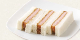
甘い誘惑ハムかつサンド [3切] 460円(税込496円)