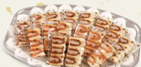
ミックスサンドオードブル A(ハーフカットヒレ10パック・ハーフカットエビ6パック) 4,250円(税込4,590円) B(ハーフカットヒレ12パック・ハーフカットエビ8パック) 5,200円(税込5,616円) C(ハーフカットヒレ14パック・ハーフカットエビ10パック) 6,400円(税込6,912円)