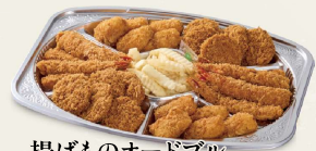
揚げものオードブル 一口ヒレかつ・海老フライ・クリームコロッケ フレンチポテト 5,050円(税込5,454円)～