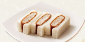
ヒレかつサンド [3切] 450円(税込486円) [6切] 885円(税込955円)