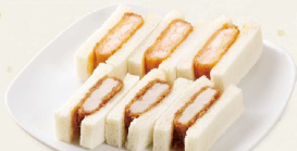
ミックスサンド(ヒレ・エビ) [各3切] 925円(税込999円)